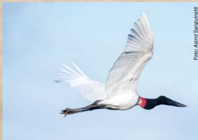
El iulo, yolo, jabirú o tuyuyú ( Jabiru mycteria ) es una de las aves más grandes y espectaculares del continente. Es tan alta como un niño (1,40m) y a diferencia de su pariente africano, el marabú, que es carroñero, nuestro “cogote colorado” prefiere la pesca.